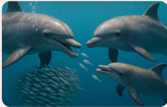
Дельфины сообщают друг другу о том, что нашли пищу, и делятся ей