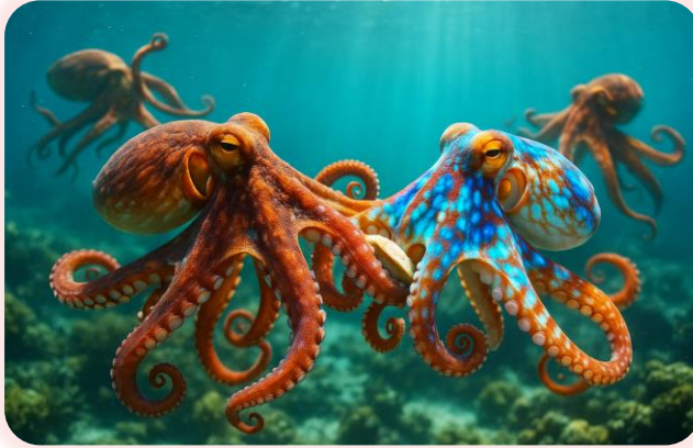
Осьминоги играют друг с другом и меняют цвет в ответ на взаимодействие