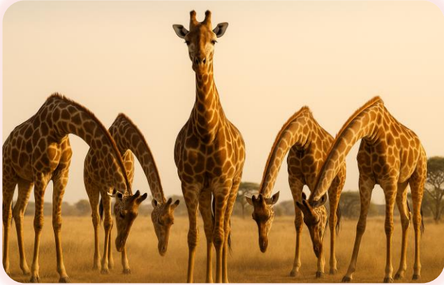
Жирафы опускают голову перед вожаком стада