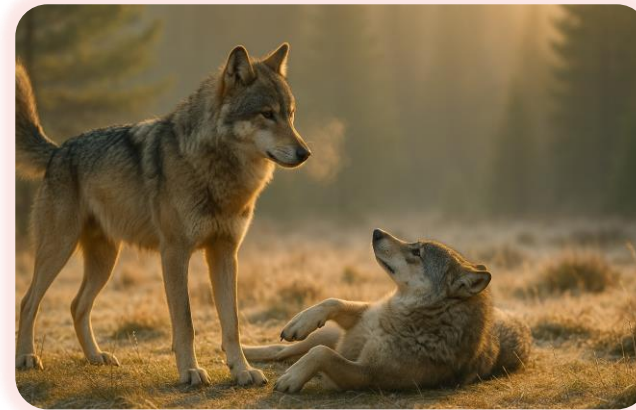
После схватки волк-победитель не убивает своего соперника, если тот сдается сам