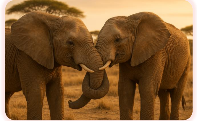
Слоны обнимают друг друга хоботом, выражая так свое уважение